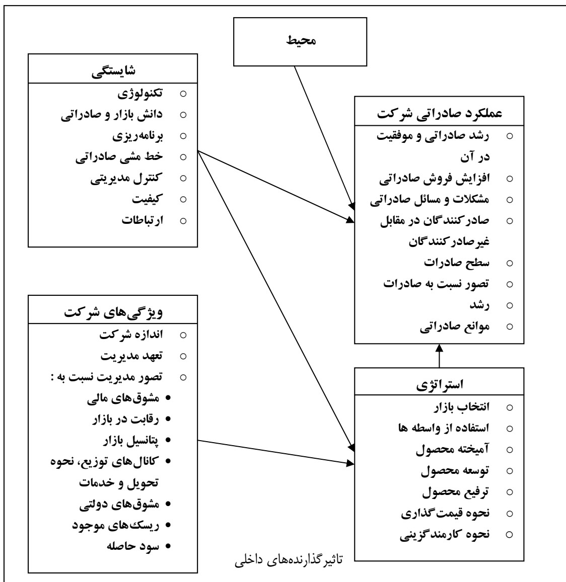
شکل ۱- مدل «ابی و اسلتر» در مورد عملکرد صادراتی و عوامل خارجی و داخلی مؤثر بر آن

روابط یک شرکت مسئول فراهم‌آوری اطلاعات و منابع و نیز تسهیل تصمیم‌گیری بهتر برای آن شرکت است. همچنین استراتژی بازاریابی شامل فاکتورهایی از قبیل انتخاب بازار، بخش‌بندی بازار و نیز عناصر آمیخته بازاریابی است.