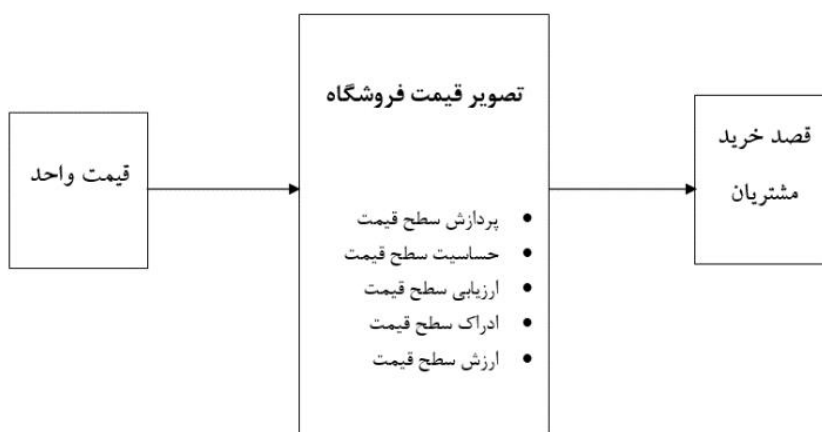
نمودار ۱- الگوی مفهومی پژوهش [۱]، [۲] و [۳]

بر قصد خرید مجدد انجام داده‌اند. هدف از این پژوهش بررسی تصویر قیمت فروشگاه و ابعاد آن بر تصمیمات مشتریان می‌باشد. جامعه آماری این پژوهش مشتریان فروشگاه‌های زنجیره‌ای در تایوان بوده‌اند. نتایج تحلیل‌ها نشان داده است که ارزش قیمت، منصفانه بودن قیمت، لذت بردن از قیمت بر تصویر قیمت فروشگاه تأثیرگذار بوده و منجر به خرید مجدد می‌شوند [۳۹]. روت و همکاران (۲۰۱۷)، پژوهشی را تحت عنوان آیا قیمت واحد بر ابعاد تصویر قیمت و قصد خرید مشتریان فروشگاه‌ها تأثیر دارد؟ انجام داده‌اند. هدف این پژوهش، بررسی تأثیر قیمت واحد بر متغیرهای تصویر قیمت (ابعاد آن شامل پردازش قیمت، حساسیت به قیمت، ارزیابی قیمت، ادراک قیمت و ارزش قیمت) و قصد خرید مشتریان در بین سه محصول شامپو، ماکارونی و نان ساندویچ بود. جامعه آماری این پژوهش مشتریان فروشگاه‌های مواد غذایی آلمان بودند. نتایج تحلیل‌ها به طور کلی نشان داد که متغیر قیمت واحد بر روی