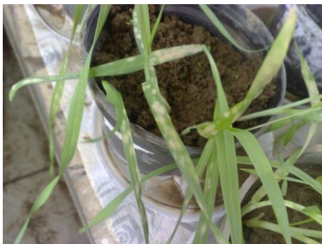
شکل ۱. ظاهر شدن علائم بیماری روی برگ‌های رقم افضل

از هر ژنوتیپ، ۳۰ بذر در پتری‌های حاوی کاغذ صافی مرطوب گذاشته شد. چهار روز بعد، پنج بذر جوانه‌زده از هر ژنوتیپ انتخاب و در گلدان‌های پلاستیکی با دهانه ۱۴ سانتی‌متر کاشته شد. گیاهچه‌ها در مرحله دوبرگی توسط سوسپانسیون قارچ عامل بیماری مایه‌زنی شدند. دوازده روز بعد صفات تیپ آلودگی و شدت آلودگی برگ‌ها براساس مقیاس ۹-۰ شدند. شکل ۱ ظاهر شدن علائم بیماری روی برگ‌های رقم افضل را نشان می‌دهد.