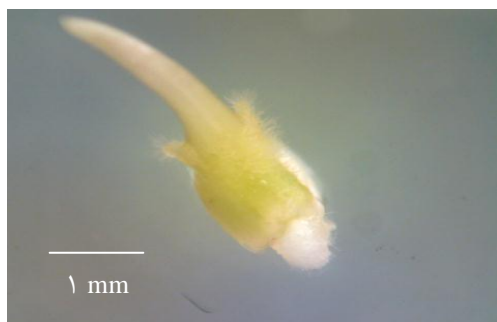
شکل ۲. باززایی نوساقه از جنین زیگوتی برنج روی محیط کشت MS

نوساقه معنی‌دار بود و در این صفت، رقم چمپای محلی تحت تیمار شاهد و رقم ساحل تحت تیمار ۱ روز نگهداری در ازت مایع به ترتیب بیشترین و کمترین طول نوساقه را داشتند (شکل ۳). نتایج تجزیه واریانس داده‌ها (جدول ۱) نشان داد که بین ارقام مورد مطالعه برای صفت درصد جوانه‌زنی نهایی تفاوت معنی‌داری وجود نداشت، درحالی که در صفات سرعت جوانه‌زنی نهایی، طول ریشه‌چه، طول گیاهچه، نسبت طول ریشه‌چه به طول نوساقه در سطح ۱ درصد و در مورد صفت شاخص بنیه جنین در سطح ۵ درصد تفاوت معنی‌داری بین ارقام بررسی شده وجود داشت. نتایج نشان داد که اثر ساده مدت زمان نگهداری در ازت مایع (۱، ۷ و ۳۰ روز و شاهد) برای صفت نسبت طول ریشه‌چه به طول نوساقه تفاوت معنی‌دار نداشت، اما در مورد صفات درصد جوانه‌زنی نهایی، سرعت جوانه‌زنی، طول ریشه‌چه، طول گیاهچه و شاخص بنیه جنین در سطح ۱ درصد تفاوت معنی‌دار بود. جدول‌های ۲ و ۳ به ترتیب نتایج مقایسه میانگین ارقام مورد مطالعه و مدت زمان‌های نگهداری جنین‌های زیگوتی در ازت مایع را نشان می‌دهند.