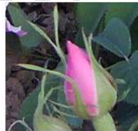
شکل شماره ۱۰ شکل شماره ۱۱ شکل شماره ۱۲

پایان می‌رسد (۹۷). میانگین روزانه، حداقل و حداکثر دما تا شروع دوره مذکور به ترتیب ۲۰، ۱۲، ۲۷ درجه سلسیوس مشاهده گردید.