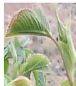
شکل شماره ۷ شکل شماره ۸ شکل شماره ۹