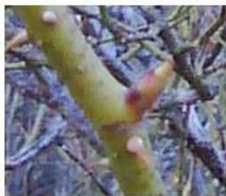
شکل شماره (۳) مرحله متورم شدن جوانه‌ها

مرحله اصلی جوانه زنی (۰): این مرحله عبارت است از تورم جوانه‌ها، مرحله مذکور به دو مرحله فرعی زیر تقسیم می‌شود. متورم شدن جوانه‌ها (۰۱): در این مرحله جوانه‌ها شروع به متورم شدن می‌کنند و فلس‌های پوشاننده را کنار می‌زنند. شروع متورم شدن در تاریخ ۲۷ اسفند و اتمام آن در تاریخ ۱۰ فروردین ماه روی داد. این مرحله با رسیدن دما به ۶.۵ درجه سلسیوس شروع گردید، میانگین روزانه، حداقل و حداکثر دما در این مرحله به ترتیب برابر ۷/۵، ۲/۲، ۱۲/۹ درجه سلسیوس بود (شکل شماره ۳).