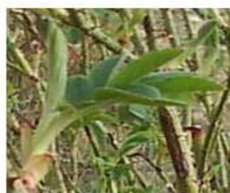
شکل شماره (۵ و ۶) مراحل نمو برگ

مرحله نمو برگ (۱): قابلیت رویت برگ‌ها (۱۰): این مرحله با آشکار شدن نخستین جفت برگ حقیقی (طول برگ به اندازه ۱۰ میلی متر) آغاز می‌شود فاز مذکور در تاریخ ۱۵ فروردین ماه در دیده بان‌ها مشخص گردید. یک برگگی شدن (۱۱): نخستین جفت برگ باز شده است. اندازه برگ هنوز کامل نشده است. برگ‌ها به رنگ سبز روشن هستند. این فاز در