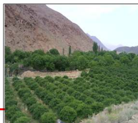
Fig.1: the study site plan

There are 450 Gole Mohammadi shrubs in 27 agricultural plots in the farm under investigation. The annual average temperature of the area is 12.5°C; the average temperature of the hottest month (July) (min. 20.1°C – max. 29.7°C) with 24.9 °C average and in the coldest month (January) (min. -3.7°C – max. 3.5°C) with a -0.1°C. The annual precipitation average of the