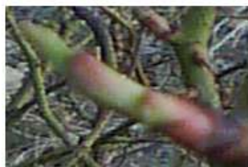
شکل شماره (۴) مرحله سبز شدن جوانه‌ها

شکفتن و سبز شدن جوانه (۰۷): آغاز مرحله سبز شدن جوانه‌ها در باغ آزمایشی در منطقه‌ی برزک در ۱۱ فروردین ماه بود. و پایان مرحله در تاریخ ۱۴ فروردین ماه بوده است. میانگین روزانه حداقل و حداکثر دما در این مرحله به ترتیب برابر ۹، ۱/۷، ۱۶/۲ درجه سلسیوس بدست آمد. (شکل شماره ۴).