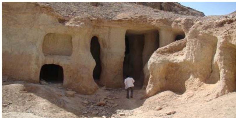
شکل (۳) دست کن‌ها یا بوکن‌ها مساکنی که در حد فاصل مناطق بروودی و آخرین پیشرفت زبانه‌های یخی ایجاد میشده است. یزد اسلامشهر (فرشاه)

سرزمینی خاصی را سبب میشوند و سرزمین ایران تنوع چشم اندازهای طبیعی و اجتماعی خود را مدیون این روابط و ویژگی‌هاست. به عبارت دیگر سیستم شکلزا مفهومی است معطوف به یک سامانه سازمند در طبیعت که منجر به شکل دادن سطوح ارضی می‌شود و ضمن آنکه قلمرو مستقلی را در حوزه فرایندهای شکلزا تعریف میکند به هویت بخشی مکان که زیربنای هویت زمین بوم‌های اجتماعی ایران است می‌پردازد