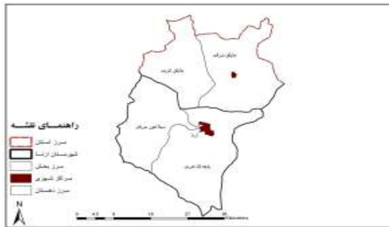
نقشه شماره ۲- موقعیت فضایی دهستان سیلاخور شرقی در شهرستان ازنا