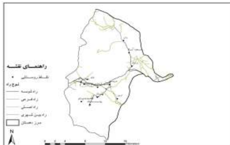
نقشه شماره ۳- موقعیت فضایی روستاها در دهستان سیلاخور شرقی