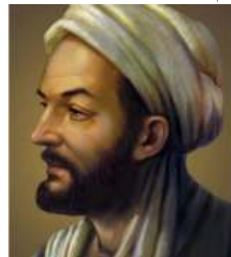
شکل ۳. تصویر ابن سینا

روزگاری اوضاع و شرایط کوه‌ها تغییر می‌کند اما شاید تاریخ دقیقی برای آن به ثبت نرسد" (ابن سینا، ۱۴۰۴: ۲۱۰). اگر به نوشته ایشان دقت نماییم می‌بینیم که از "روزی و روزگاری" .. و یا... "تاریخی نامشخص" .. برای تغییرات سطح زمین قائل بوده و عقیده هوتون یعنی "نه نشانی از شروع و نه چشم اندازی برای آینده" بسیار شبیه به بیان ابوعلی سینا است. ابن سینا این تغییرات را در قالب یک چرخه نیز به طور کامل بیان می‌کند آن جا که می‌فرماید: "سپس کوه‌ها تازه شده و ارتفاع می‌گیرند...". در این نوشته کوتاه به فرایندهای فرسایش به خوبی اشاره شده و حتی نوع فرایندها که شامل فرایندهای دامنه‌ای و سپس رودخانه‌ها با همان رویکرد سیستمی است پرداخته شده است. منظور از گل‌های نزدیک کوه‌ها همان رسوبات همزمان با فرایندهاست که بعد به وسیله ژئومورفولوژیست‌های تاریخی در تحلیل لندفرم‌ها مورد استفاده قرار گرفت. به عبارت دیگر تحلیل لندفرم‌های قدیمی‌تر بر مبنای شرایط حاضر توسط ابن سینا انجام گرفته و این همان بیان لیل است که " زمان حال کلید فهم گذشته است".