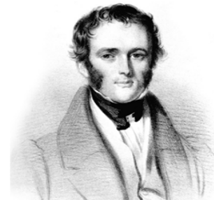
شکل ۲. چارلز لیل در حدود سال ۱۸۳۶. ترسیم از J.M. Wright (برگرفته از Virgili, 2007,573)

نظریه کاتاستروفیسم مجدداً در قرن ۲۰ برای توضیح برخی تغییرات ناگهانی در تکامل چشم انداز ظهور کرد. برتز ۷ (۱۹۲۳) بر اساس سیلاب‌های بزرگ رها شده بر اثر شکستن سد یخچالی پلیستوسن در محدوده وسیعی از آمریکای شمالی، کاتاستروفیک را احیاء کرد. سیلاب‌های بزرگ رها شده از دریاچه میسولای پلیستوسن عامل حفر کانال‌های بزرگ اسکابلند ۸ در واشنگتن شرقی معرفی شد، پدیده‌ای که برای یک دوره طولانی با شک و تردید مواجه شد اما بعد توسط افراد متعددی از جمله بیکر ۹ مجدداً بررسی بررسی و بر نقش کاتاستروفیکی آنها تاکید شد. همان گونه که شکل ۳ نشان می‌دهد طی چند دهه اخیر کاتاستروفیسم احیاء شده با ساختاری نسبتاً قوی‌تر و