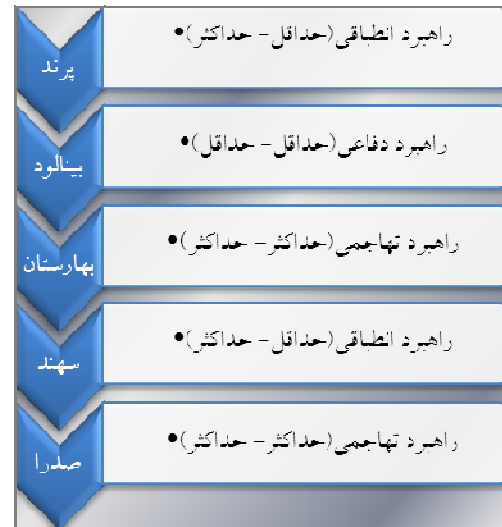
شکل ۲- راهبردهای پیشنهادی برای شهرهای مورد

با توجه به نتایج به دست آمده از ارزیابی کمی و میزان موفقیت شهرهای جدید به عنوان شهرهایی پویا و زنده، همچنین راهبردهای چهارگانه این تکنیک و نتایج تحلیلی بدست آمده، متناسب با شرایط هر شهر جدید راهبردهایی به شرح زیر پیشنهاد می‌گردد: