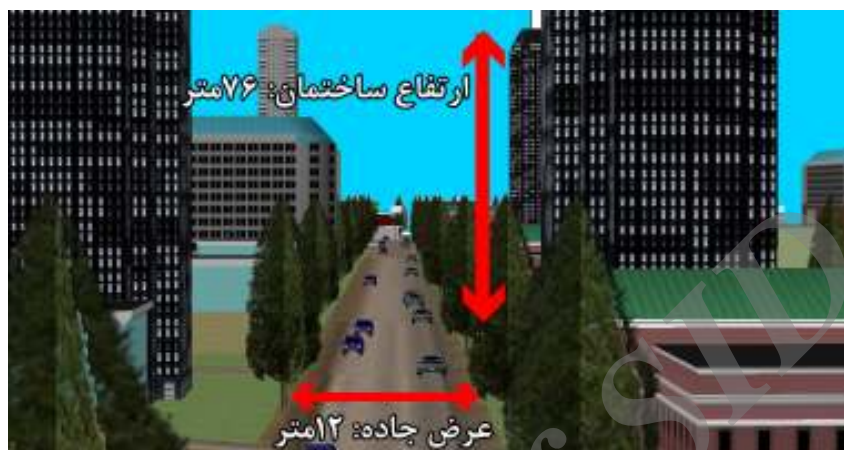
شکل ۳ - مدل سه بعدی بخشی از مسیر پیشنهادی شماره یک

شکل ۴ نیز بخشی از مدل سه بعدی مسیر شماره یک را نشان می‌دهد که در آن ارتفاع یکی از ساختمان‌ها و عرض یکی از معابر مشخص شده است. کلیه این