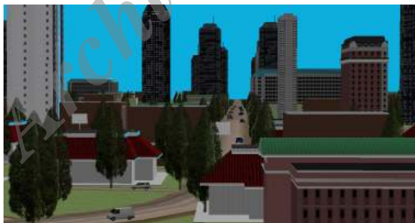
شکل ۲ - مدل سه‌بعدی بخشی از مسیر پیشنهادی شماره یک

چهار مسیر فوق توسط کارشناس از روی مدل سه‌بعدی منطقه انتخاب گردیده است. شکل ۳ بخشی از مدل سه‌بعدی مسیر شماره یک را نشان می‌دهد. همانطور که در شکل مشخص است، ساختمان‌های بلندمرتبه‌ای در کنار جاده‌ای با عرض کم وجود دارد. لیکن چنانچه این ساختمان‌ها تخریب گردند احتمال