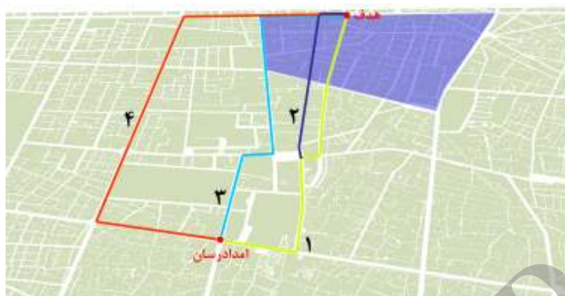
شکل ۱ - چهار مسیر پیشنهادی انتخاب شده توسط کارشناس

اسناد مسیر زیاد است. اما ممکن است قدمت ساختمان‌ها و نحوه ساخت این سازه‌ها به نحوی باشد که کارشناس احتمال تخریب آن‌ها را کم ببیند و آن را به عنوان یکی از مسیرهای پیشنهادی انتخاب نماید. بنابراین، کارشناس می‌تواند با مشاهده این مدل‌ها به شناسایی مسیرهای مناسب بپردازد.