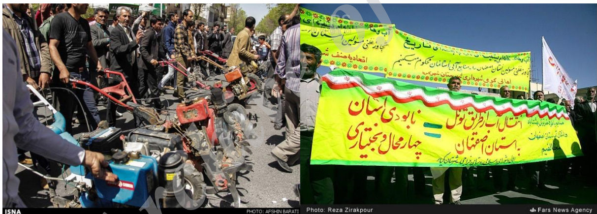
شکل ۴. اعتراض مردم چهارمحال و بختیاری در انتقال آب کارون به استان اصفهان

پس از اعتراض مردم خوزستان به انتقال آب اصفهان، مردم چهارمحال و بختیاری در ۲۸ فروردین ۱۳۹۳ با تجمع مقابل استانداری، اعتراض خود را به