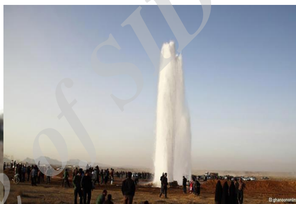
شکل ۲. اعتراض کشاورزان شرق استان اصفهان و قطع لوله انتقال آب استان یزد به‌دست کشاورزان

و مشکلات زیادی برای مردم به‌وجود آوردند که در نتیجه باعث قطعی و جیره‌بندی آب در ۱۳ شهر استان یزد شد (شکل ۲). در مقابل مسئولان یزد، استان اصفهان را با قطع سنگ آهن مجتمع ذوب آهن اصفهان تهدید کردند که از یزد تأمین می‌شود. البته پیشینه و زمینه این درگیری به شهریورماه ۱۳۹۰ برمی‌گردد که آب زاینده‌رود برای کشاورزان شرق استان اصفهان جاری شد، ولی از تیرماه ۱۳۹۱ همان‌طور که پیش‌بینی