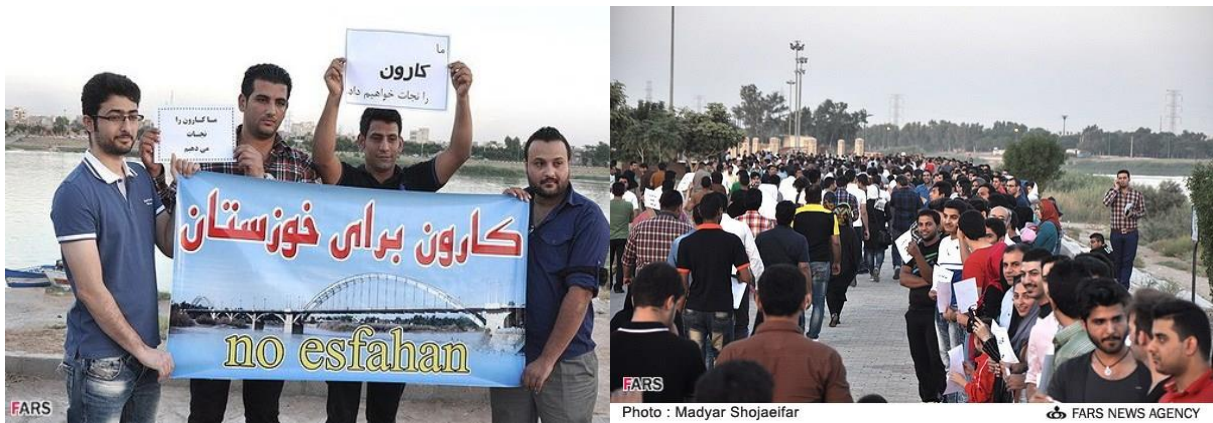
شکل ۳. اعتراض مردم استان خوزستان در انتقال آب کارون به استان اصفهان

انتقال آب این استان به اصفهان از طریق تونل بهشت‌آباد اعلام کردند (شکل ۴) (سایت خبری تحلیلی الف، ۱۳۹۳/۱/۲۸).