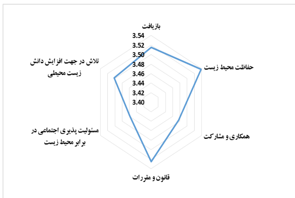
شکل ۳. میانگین عوامل رفتارهای زیست محیط گرایانه حاصل از تحلیل عاملی اکتشافی

جایکا بیشترین تغییر را در رفتار زیست محیطی روستاییان در روستای تبرک سفلی و کمترین تأثیر را در روستای گزستان داشته است. در روستای تبرک سفلی همان طور که از نام این روستا پیداست ۲ ، با اجرای طرح جایکا و افزایش دانش زیست محیطی عشایر، جایگزینی مشاغل دیگر و...، تغییر نگرش و رفتار عشایر ملموس تر بوده است؛ در حالی که در روستای گزستان به علت آگاهی و نیز اشتغال بیشتر در سایر مشاغل همانند معادن اطراف، دامداری، کشاورزی، گیاهان دارویی و... این گونه نبوده است.