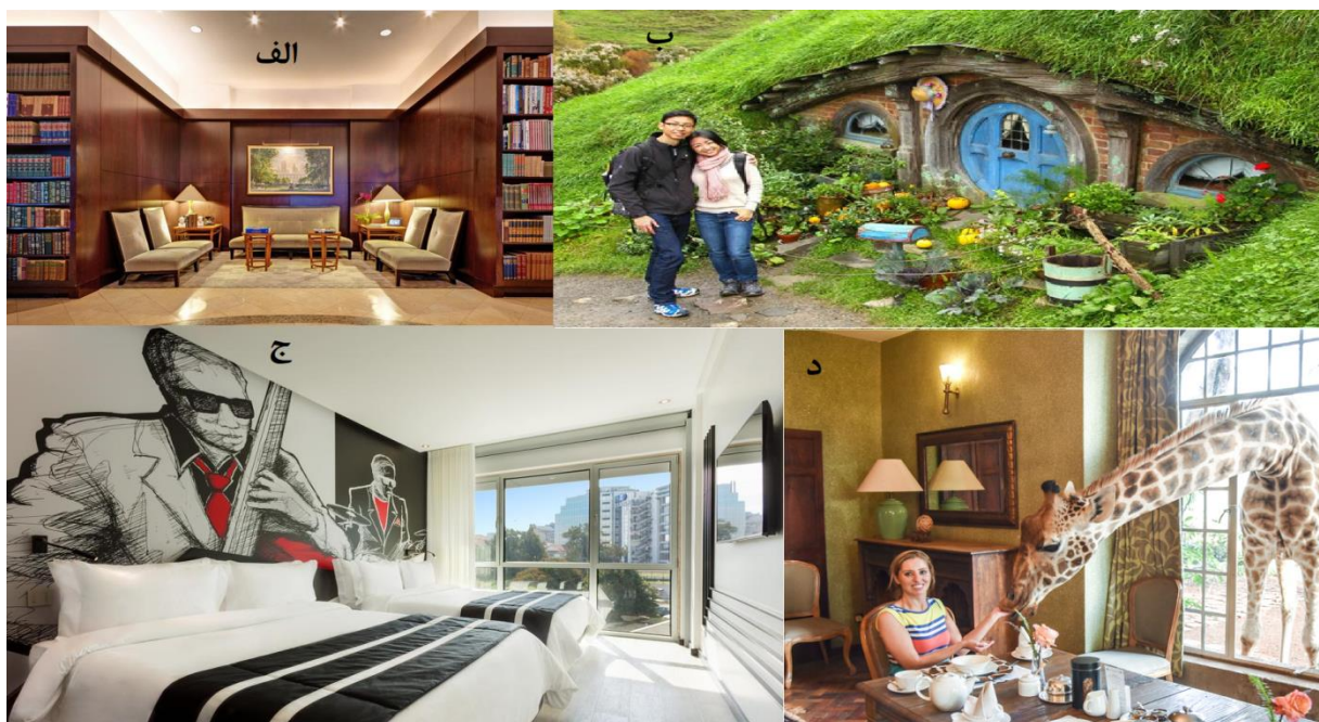
شکل ۱. نمونه‌ای از هتل‌های موضوعی در جهان (شکل ۱ الف: هتل کتابخانه نیویورک آمریکا (منبع: https://www.pinterest.com/pin/ ؛ شکل ۱ ب: هتل هاییت در نیوزلند (منبع: https://libraryhotel.com/en/596938125582774898 )؛ شکل ۱ ج: هتل موسیقی افاج فنیکس در لیسبون پرتغال ( https://www.cybevasion.fr/hotel-hf-fenix-music-lisbonne-h729787_en.html )؛ شکل ۱ د: هتل مانور زرافه در کنیا ( https://www.tripadvisor.com/Hotel_Review-g294207-d302824-Reviews-Giraffe_Manor-Nairobi.html )).

مشتریان از اقامت در هتل‌های موضوعی به دست آورده‌اند که عبارت‌اند از: منحصر به فرد بودن، تمایل و انسجام، موضوع فرهنگ و کیفیت تجربه، جذابیت موضوع، موقعیت جغرافیایی و موضوع معماری، طراحی و سرویس داخلی و اتمسفر آن، موضوع امکانات و کالاهای اساسی، موضوعات وابسته و کالا، فعالیت‌ها و خدمات.