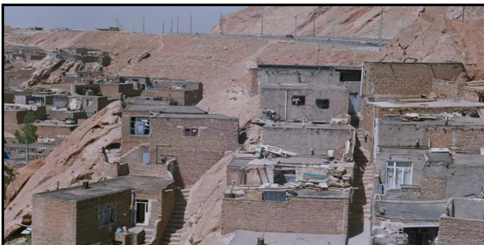
شکل شماره ۲- نحوه ساخت و ساز و دسترسی‌ها در مناطق حاشیه‌نشین تبریز