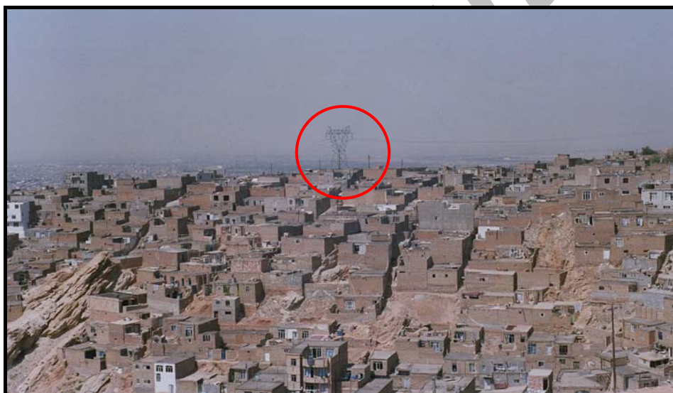
شکل شماره ۳- موقعیت دکل فشار قوی برق نسبت به مناطق مسکونی (عکس از نگارندگان)