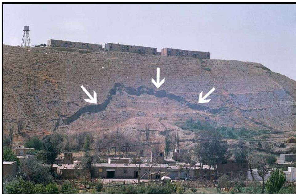
شکل شماره ۴- لغزش زمین در منطقه نگین پارک تبریز