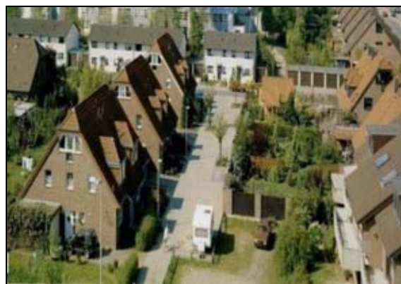
شکل ۳- فاصله مناسب بلوک‌های ساختمانی

شکل پله‌کانی ساختمان‌ها تأثیر زیادی در کاهش میزان آوار ریخته شده در معابر داشته و شکل ساختمان با گوشه‌های گرد در کاهش تأثیر موج انفجار و مستهلک کردن آن موثر است (فرزام شاد، ۱۳۸۹، ۵۹). همچنین شکل نمای ساختمان و همگونی آن با شرایط محیط طبیعی از جنبه اصول استتار و فریب و عدم جلب توجه دشمن در پدافند غیرعامل حائز اهمیت است (شکل ۵). حذف عناصر زاید از قبیل مجسمه‌های سنگی حجیم و سنگین، ستون‌های بزرگ، تراس‌ها و... از عوامل موثر در کاهش تلفات جانی در مناطق مسکونی محسوب می‌شود. زیرا که پرتاب این عناصر زاید و حجیم در اثر موج انفجار نقش ترکش‌های ثانویه را بازی کرده و موجب افزایش