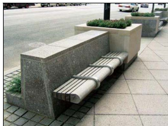
شکل ۴- استفاده از مبلمان شهری به عنوان جان پناه