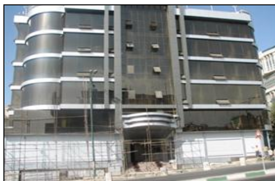
شکل ۶- استفاده از نماهای شیشه‌ای در ساختمان‌ها