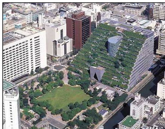
شکل ۵- ساختمان پله‌ای شکل با درختچه‌های کاشته

استفاده از نماهای شیشه‌ای و پنجره‌های بزرگ در مجاورت محوطه‌ها بدون رعایت تمهیدات لازم به دلیل پرتاب قطعات شیشه به اطراف، عامل موثری در افزایش تلفات و خسارات در محوطه‌ها می‌باشد. لازم است در صورت استفاده از این عناصر اولاً قطعات شیشه توسط قاب تا حد امکان کوچک انتخاب شوند ثانیاً نوع شیشه از نوع مسلح باشد. تورفتگی پنجره‌ها و پیش بینی بالکن نیز می‌تواند کمک موثری در کاهش آسیب‌ها باشد (فرزام شاد، ۱۳۸۹، ۶۳). (شکل ۶)