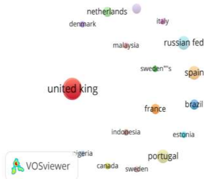
شکل ۱: کشورهای که در این زمینه فعالیت کرده‌اند