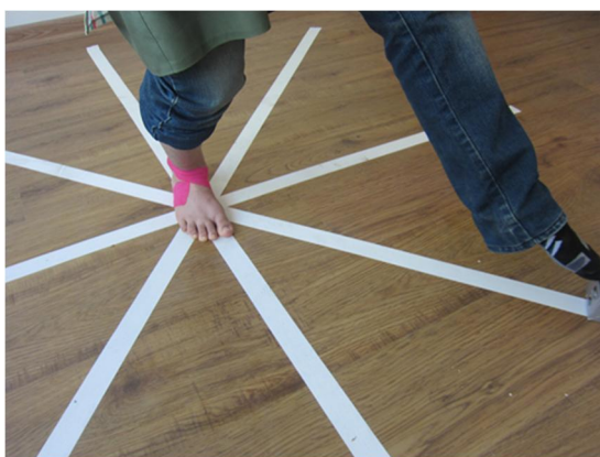
شکل ۲: تست ستاره هشت وجهی قبل و بعد از کینزیوتیپ

یافته ها: بررسی آزمودنی‌ها قبل از استفاده از کینزیوتیپ، نشان داد که تفاوت معنی‌داری در نتایج تست ستاره بین دو گروه پای طبیعی و پرونیت در هفت جهت حرکتی وجود نداشت و تنها در جهت خلفی اختلاف معنی‌دار مشاهده شد ( P = 0/04 ) همچنین مشاهده شد که این دو گروه پس از استفاده از کینزیوتیپ در هیچ یک از جهات تست ستاره اختلاف معنی‌داری نداشتند (نمودار ۱).