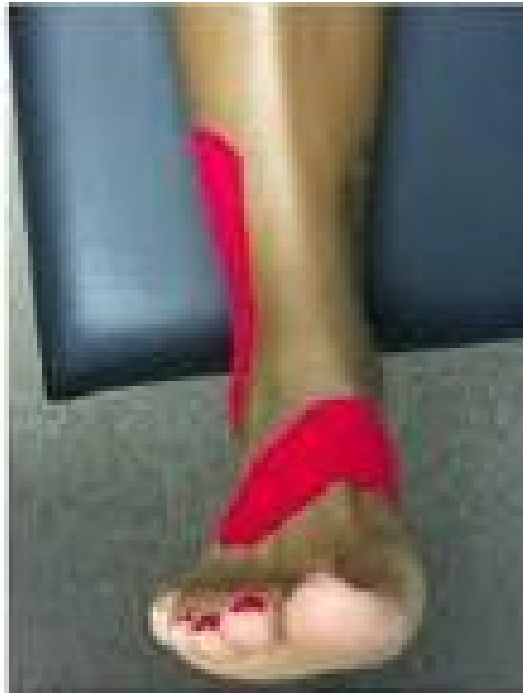
شکل ۲: طریقه استفاده از کینزیوتیپ به شکل ۸ انگلیسی