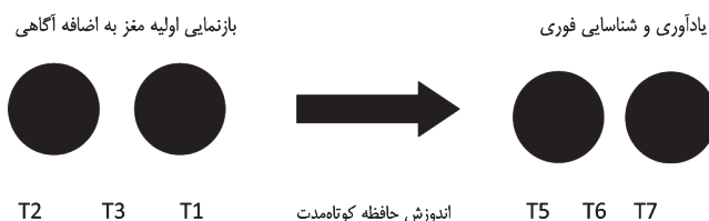
نمودار شماره ۴. تبیین ارولی تهای حافظه از حرکت دیداری ظاهر

واحد زمان جدا می شود و فاصله هیچ دخالتی در آن ندارد. در این حالت هیچ حرکتی احساس نمی شود. اما بلافاصله بعد از تجربه در حافظه ثبت می شود به طوری که شامل واسطه گری گذرا و مفهوم حرکتی می شود که با آن به وجود می آید. بنابراین داشتن تجربه به معنی تشخیص و تفسیر فرد از آن تجربه بوده و شامل مفهوم حرکت هم می شود و پاسخ فوری او به این پرسش که «آن چه بود؟» این است که دایره ای که حاصل حرکت از نقطه ای به نقطه دیگر است.