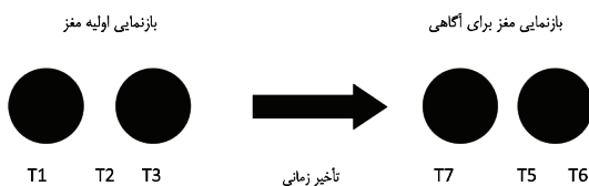
نمودار شماره ۳. تبیین استالینی از تأخیر زمانی حرکت دیداری ظاهری

نمودار شماره ۳ تبیین استالینی را نشان می‌دهد که در آن مجموعه‌ای از وقایع منفصل و موقت از T۱ تا T۷ رخ می‌دهند و هریک، یک‌صد هزارم ثانیه یا چیزی در این حدود طول می‌کشد. این تبیین ادعا می‌کند که بین بازنمایی اولیه مغز از دو نور کوتاه گذرا و زمانی که چرخه‌ها در آگاهی تجربه می‌شوند، تأخیری وجود دارد. قبل از به تأخیر انداختن زمان، بازنمایی انجام می‌شود اما از آگاهی خبری نیست. بعد از این تأخیر محدوده بین چرخه‌های چپ و راست شامل تصاویر گذرای هستند که به تجربه حرکت کمک می‌کنند. این پیامد از وقایع، نوعی پیش‌آگاهی را آشکار می‌سازد که تجربه آگاه را ویرایش می‌کند.