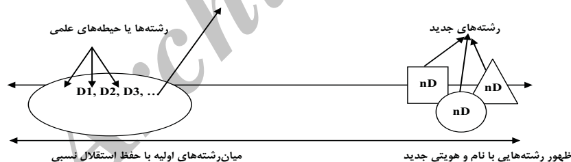
شکل ۲- طیف رویکرد برنامه‌ریزی میان‌رشته‌ای

تفاوت را مشخص کرد. در میان رشته‌ای، همه رشته‌های عضو، عضوی از یک خانواده اما در چند رشته‌ای، رشته‌ها، خانواده‌های مستقل در یک مجتمع مسکونی تلقی می‌شوند. در میان رشته‌ای هدف به هم ریختن مرزهای رشته‌ها و به دنبال آن هم‌خانواده شدن در راستای اهداف مشترک است، لذا این سوال مطرح است که کدام رشته با کدام رشته هم‌خانواده شود؟ پاسخ این سوال در گروه نیازهایی است که ایجاد می‌شود و این احساس نیاز مختلف از راه‌های مختلفی صورت گیرد: یا احساس نیاز از درون رشته است که به قول هایدگر در روند تحول و پویایی درون یک علم و به تعبیر فوکر «در درون رژیم‌های حقیقت» اتفاق می‌افتد و در نتیجه نیاز به برقراری ارتباط با سایر حوزه‌ها و رشته‌ها پیدا می‌کند و یا این احساس نیاز خارج از رشته یعنی ناشی از نیازها و حتی فشارهای اجتماعی است که البته ممکن است در یک زمان هر دو نیاز نیز اتفاق بیفتند. در نتیجه این شرایط، دو یا چند رشته در نزدیکی و ارتباط بیشتر با یکدیگر قرار می‌گیرند تا با هم‌زبانی بیشتر و ارتباط تنگاتنگ، بهتر بتوانند به مسائل و موضوعات و نیازهای ایجادشده پاسخ گویند. طبیعی است در این فرایند شاهد اختلاف‌های زبانی، فرهنگی، منطقی و روشی خواهیم بود که بایستی با تبادل نظر و استدلال دقیق و سیستمی بر آنها فائق آمد. این رویکرد خود طیفی را دربرمی‌گیرد. ممکن است استقلال هریک از اعضا همچنان حفظ شود و یا اینکه با ترکیب پیچیده اعضا حتی رشته‌ای با عنوان و هویتی جدید ظهور پیدا کند.