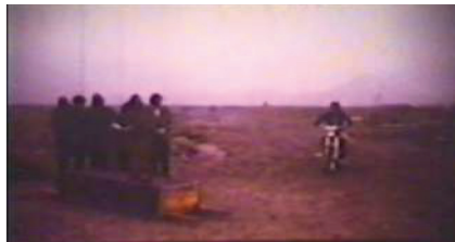
تصویر ۱۹: مرگ پدر علی و بی‌توجهی و دیر رسیدن او به گورستان دقیقه: ۵۲، ۵۳، ۰۱