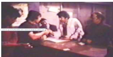
تصویر ۷: پادرمیانی سامری برای ورود پدر علی به بیمارستان دقیقه: ۰۳، ۲۵