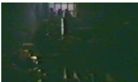
تصویر ۵: ورود عده‌ای به آزمایشگاه و خروج از آن / دقیقه: ۱۶، ۵۴