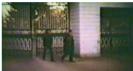
تصویر ۳: ورود به بیمارستان / دقیقه: ۰۶، ۰۲