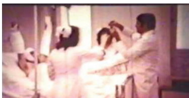
تصویر ۱۱: تفریح دکتر با پرستارها در کنار بستر بیمار دقیقه: ۰۹، ۳۱