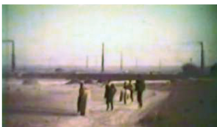
تصویر ۱: در جاده و به سمت شهر / دقیقه: ۰۱، ۳۹