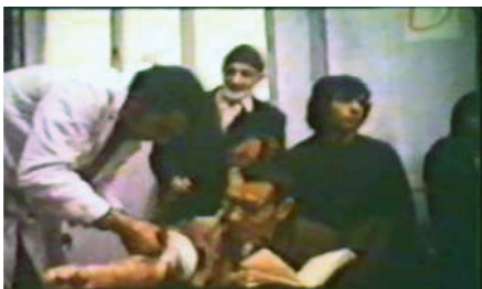
تصویر ۶: ورود به جریان خون‌گیری و خون‌فروشی / دقیقه: ۲۰، ۲۸