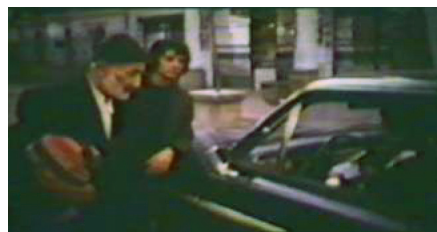
تصویر ۴: آشنایی با سامری / دقیقه: ۰۷، ۱۳