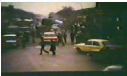
تصویر ۲: ورود به شهر / دقیقه: ۰۵، ۴۶