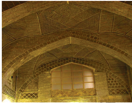
تصاویر ۲ و ۳. مسجد جامع اصفهان (سمت راست) و بازار اصفهان (سمت چپ)

شباهت معنادار الگوهای کالبدی - فضایی مسجد و بازار در تصویر این دو بنا مشخص است. این شباهت در بسیاری از مساجد و بازارهای سنتی دیگر نیز قابل مشاهده است.