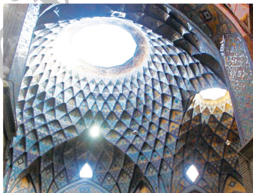
تصویر ۱. بازار کاشان، تیمچه امین‌الدوله، شباهت معنادار آسمانه تیمچه به آسمانه مساجد

ترك می‌کند برمی‌گردد» (شیخ حرعاملی، ۱۴۰۹ق، جلد ۱۷: ۴۶۸). در روایتی دیگر چنین نقل شده است: «بازار، سرای بی‌خبری و غفلت است. لذا هر که در بازار يك تسبیح گوید، خداوند هزار هزار ثواب برایش رقم زند» (محمدی ری‌شهری، ۱۴۲۲ق: ۲۸۶). همان‌طور که ملاحظه می‌گردد، طبق روایات فوق، فضای بازار به لحاظ نوع عملکرد و فعالیت‌هایی که در آن جاری است، قابلیت زیادی برای ایجاد غفلت از حقایق معنوی در انسان دارد، لذا بایسته است که در طراحی بازارها و مراکز تجاری از ایده‌هایی استفاده شود که این غفلت‌زایی به کمترین میزان ممکن برسد. این مهم در طراحی بازارهای سنتی ایران به طرز شایسته مورد توجه قرار می‌گرفته و بسیاری از عناصر و اجزای کالبدی بازار، متذکر حقایق معنوی بودند به نحوی که حتی بسیاری از عناصر و جزئیات کالبدی - فضایی بازارها همچون مساجد بود و از این رو، فضای بازار یادآور فضای معنوی مسجد بوده است. بدیهی است که این امر بر تضعیف قابلیت غفلت‌زایی بازار مؤثر بوده است (تصاویر ۱، ۲ و ۳). اما الگوهای کالبدی - فضایی بازارها و مراکز تجاری معاصر به شکل کاملاً محسوسی با مساجد و مراکز عبادی متفاوت است، لذا برخلاف بازارهای سنتی، الگوهای کالبدی - فضایی مراکز تجاری معاصر، جنبه‌های تذکر بخش چندان‌ی را به کاربران خود ارائه نمی‌نمایند.