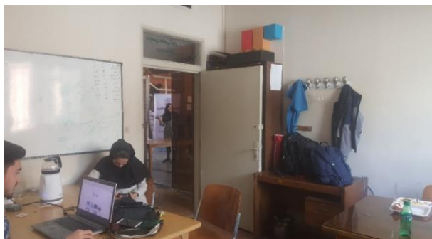
تصویر شماره (۲). فضای کلی داخل اتاق آمار و علوم کامپیوتر دانشگاه شهید بهشتی