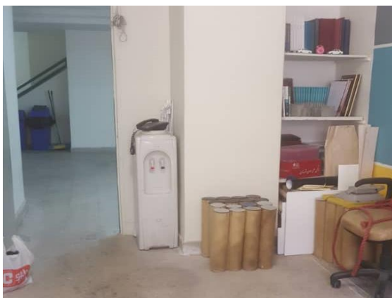
تصویر شماره (۱). اتاق انجمن معماری در دانشکده معماری دانشگاه علم و صنعت ایران

برخی از دانشگاه ها هم مانند دانشگاه تربیت مدرس وضعیت متفاوتی دارند. پس از انجام مصاحبه با دانشجویان مختلف و اعضای انجمن های گوناگون در دانشگاه تربیت مدرس، مشخص شد که به طور کلی، مشکلات دانشجویی در این دانشگاه مانند قبل فعالیت نداشته و تمایل دانشجویان برای شرکت نیز بسیار کاهش یافته است. اکثر دانشجویان با بیان این که در حال حاضر دغدغه های دیگری مانند دغدغه های مالی دارند، از شرکت در این انجمن ها صرف نظر می کنند.