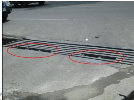
تصویر ۴: نمونه‌ای از یک پل ارتباطی ناهموار نامناسب برای عبور معلولین