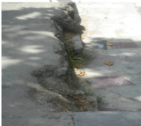
تصویر ۲: تعبیه‌نشدن جدول بین پیاده‌رو و جوی کنار آن

شهر محسوب می‌شود. این خیابان از میدان شهدا در شمال شروع و پس از عبور از زاینده‌رود به میدان آزادی (دروازه شیراز) در دامنه کوه صفه در جنوب اصفهان ختم می‌شود.