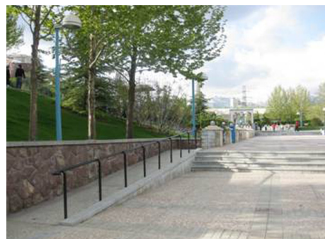
تصویر ۱۱: پارک گفتگو نمونه‌ای از طراحی مناسب برای استفاده معلولین (منبع: ۲۰)