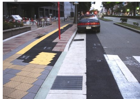
تصویر ۱۰: حذف لبه جدول در محل ورودی پیاده‌رو جهت عبور ویلچر (منبع: ۱۹)

نمونه‌های اجراشده از اصلاح و مناسب‌سازی معابر