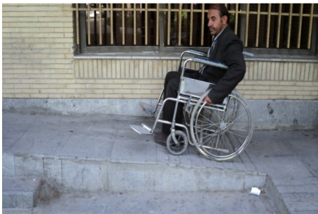
تصویر ۸: نصب‌نشدن دستگیره در طرفین رامپ