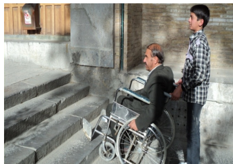
تصویر ۶: وجود اختلاف سطح در مسیر پیاده‌راه و تعبیه‌نشدن رامپ در کنار آن