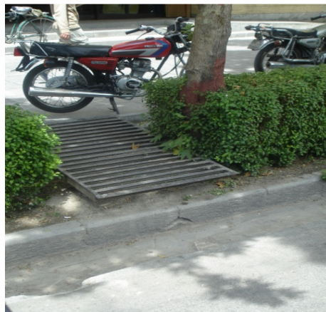
تصویر ۵: قطع پیوستگی پل ارتباطی با خیابان