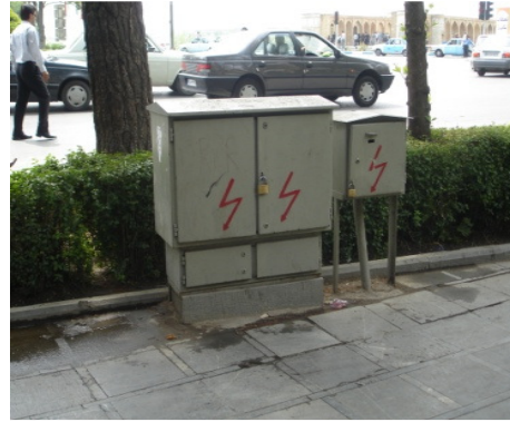
تصویر ۳: استقرار غلط مبلمان در معابر