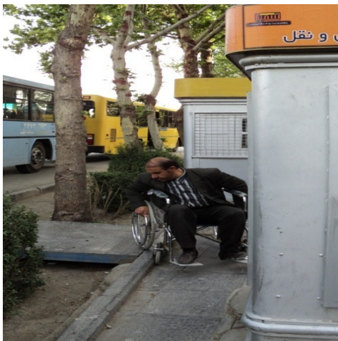
تصویر ۹: غیرهمسطح بودن پل یا پیاده‌رو و وجود مانع در مسیر حرکت (منبع: نگارنده، ۱۳۹۰)