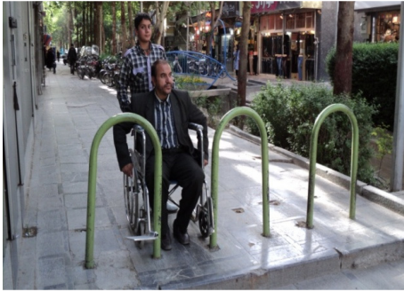
تصویر ۷: وجود موانع در ابتدای برخی ورودی‌ها