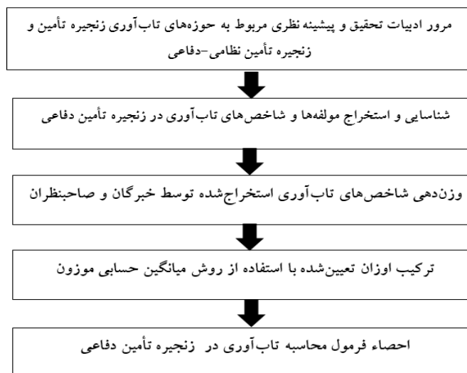
شکل شماره ۳. گام‌های تحقیق

فرم وزن‌دهی شاخص‌ها جهت آگاهی از نظرات خبرگان، میان آن‌ها توزیع شد. در این فرم ۱۱ شاخص تاب‌آوری زنجیره تأمین دفاعی مطابق جدول (۴) قید گردید تا خبرگان به وزن‌دهی شاخص‌های تعیین‌شده از ۱ تا ۲۰ پردازند. خبرگان این تحقیق از خبرگان و اعضای هیئت علمی پژوهشکده آماد، فناوری و عرصه‌های نوپدید مرتبط با این حوزه در دانشگاه عالی دفاع ملی انتخاب شدند. به‌منظور ترکیب اوزان تعیین‌شده توسط هر یک از خبرگان و صاحب‌نظران، روش‌های متعددی نظیر فراوانی نسبی، میانگین حسابی موزون، آنتروپی شانون، انحراف معیار، استفاده از ماتریس‌های مقایسات زوجی و روش سوارا وجود دارد (اصغری‌زاده و محمدی بالانی، ۱۳۹۷). اما غالب آن‌ها به‌جز روش میانگین حسابی موزون به شاخص‌هایی که واگرایی بیشتری نسبت به شاخص‌های دیگر دارند، اهمیت بیشتری می‌دهند که این مورد در این تحقیق مدنظر محقق نیست.