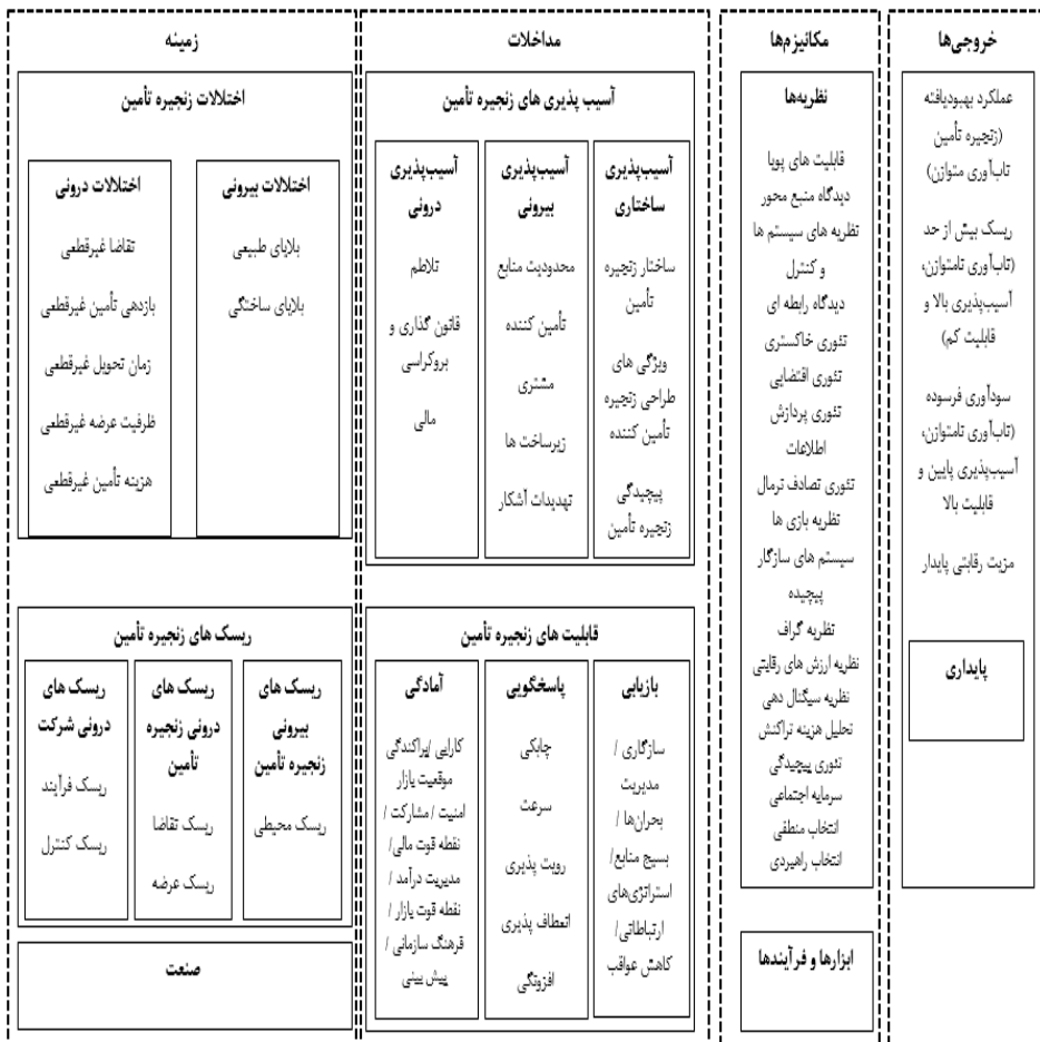
شکل شماره ۲. الگوی زنجیره تأمین تاب‌آور (کوچان و نویکی، ۲۰۱۸)

پس از تعریف تاب‌آوری زنجیره تأمین به‌منظور درک بهتر این مفهوم در زنجیره تأمین و برخورداری از رویکردی جامع و کامل نسبت به این مفهوم، چارچوب یک زنجیره تأمین تاب‌آور مطابق شکل (۲) می‌باشد.