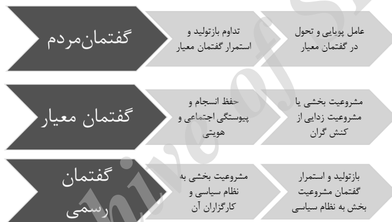
شکل (۲): گفتمان‌های سه‌گانه و کارکردهای آنها

بنیادین گفتمانی میان کارگزاران مدنی گفتمان معیار و کارگزاران دولتی گفتمان رسمی است. با توجه به مفهوم‌پردازی‌های مذکور می‌توان گفت امنیت فرهنگی از دیدگاه مردم، شرایطی است که در آن امکان استمرار، بازتولید و پویایی گفتمان معیار وجود داشته باشد. از دیدگاه نظام سیاسی نیز امنیت فرهنگی شرایطی است که گفتمان فرهنگی مسلط بر مردم، با گفتمان فرهنگی مشروعیت‌بخش به نظام سیاسی سازگار باشد. بر این اساس، هر پدیده یا کنشی که موجب شکاف میان گفتمان معیار و گفتمان فرهنگی حاکم بر نسل زنده یک ملت شود یا موجب شکاف میان گفتمان معیار و گفتمان نظام سیاسی حاکم بر ملت شود و یا به شکاف میان گفتمان مورد نظر نظام سیاسی و گفتمان مسلط بر مردم بینجامد، تهدیدی علیه امنیت جامعه است.