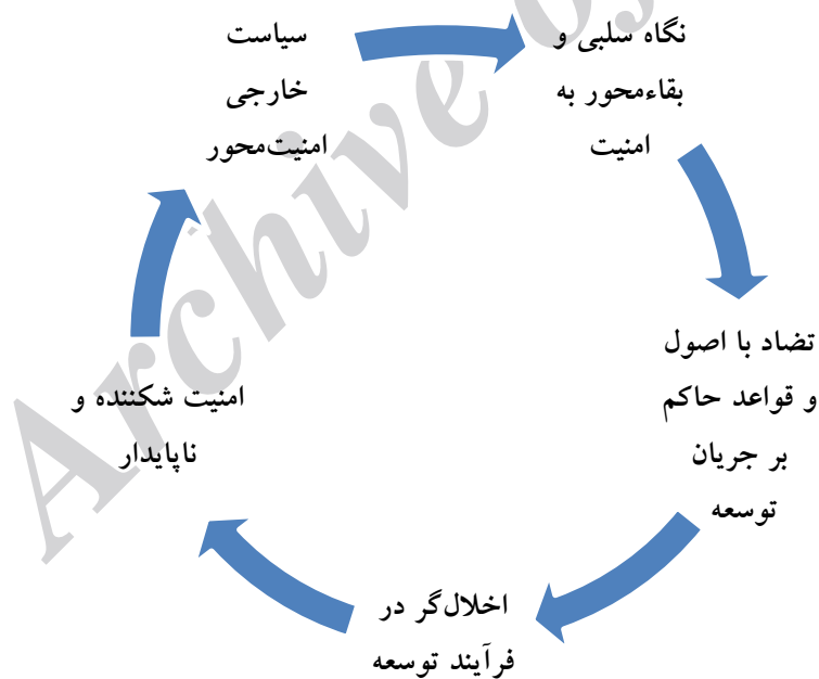
شکل ۱. سیاست خارجی امنیت‌محور؛ امنیت و توسعه

ندارد، اما در سیاست خارجی امنیت‌محور و معطوف به مسائل محض ژئوپلیتیکی، این دوگانگی مشهود است؛ یعنی سیاست خارجی لزوماً در خدمت اقتصاد نیست و دیپلماسی اقتصادی ضعیف است و این برداشت نیز وجود ندارد که توسعه اقتصادی داخلی می‌تواند بر سیاست خارجی اثر فوق‌العاده‌ای برجای بگذارد (Ubi and Akinkuotu, 2014: 415). در مجموع، در رابطه با نسبت سیاست خارجی با امنیت و توسعه دو رویکرد عمده وجود دارد که تحت عنوان «سیاست خارجی امنیت‌محور» و «سیاست خارجی توسعه‌گرا» مفهوم‌بندی شده‌اند. تفاوت میان سیاست خارجی امنیت‌محور و سیاست خارجی توسعه‌گرا یا توسعه‌گرا و پیامدها و تأثیرات هر کدام از این دو رویکرد در سیاست خارجی بر بحث توسعه و امنیت را در قالب شکل‌های زیر می‌توان به تصویر کشید.