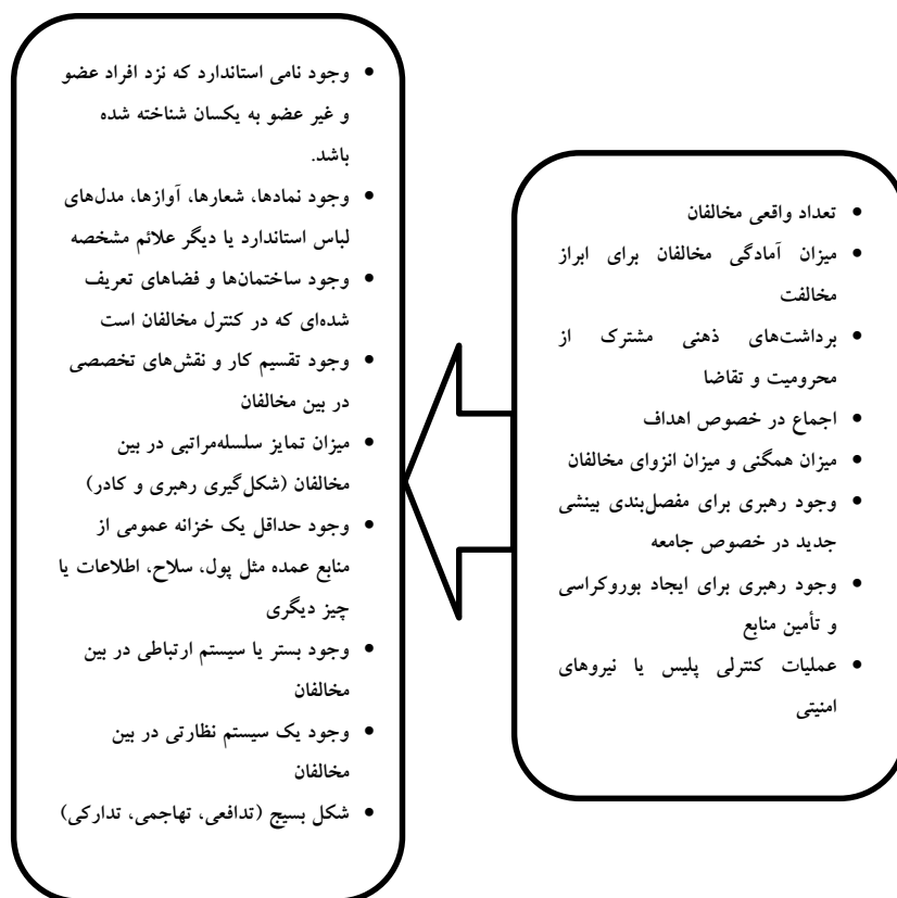
نمودار ۲. مدل مفهومی سازماندهی در ناآرامی خیابانی

در نمودار مذکور، جهت فلش نشان‌دهنده جهت تأثیر عوامل مؤثر بر سازماندهی بر شاخص‌های سازماندهی است. یعنی عواملی که در سمت راست نمودار ذکر شده‌اند بر شاخص‌هایی که در سمت چپ نمودار قرار دارند، تأثیرگذار هستند. با بررسی عوامل سمت راست می‌تواند دلایل افزایش یا کاهش میزان سازماندهی در ناآرامی خیابانی را تحلیل کرد. برای ارائه برآوردی از میزان سازماندهی یک حرکت جمعی هم باید وضعیت شاخص‌های سمت چپ را مشخص کرد.