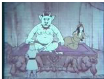
دیو سفید: «فیلم انیمیشن ملک خورشید»

شخصیت «دیو سفید» که ملهم از شاهنامه‌ی فردوسی است، از نظر بصری به شخصیت‌های نگارگری شده از داستان‌های شاهنامه به‌خصوص در مکتب هرات و اصفهان و همچنین در نقاشی‌های سبک قهوه‌خانه‌ای از جمله آثار نقاشی «قوللر آغاسی» شبیه است. طنز موجود در شخصیت دیو سفید و تضاد آن با هیبت خشن و هراس‌آور او، به خوبی توانسته به نوعی خاص و منحصر به فرد، به شخصیت‌های منفی در انیمیشن ایران تبدیل شود.