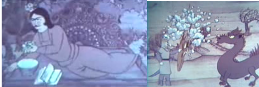
نمونه‌هایی از فضاها و شخصیت‌های «فیلم انیمیشن ملک خورشید»