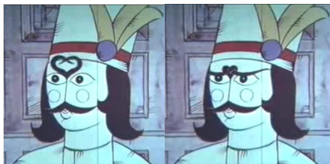
شخصیت ملک خورشید، بیان احساسات: «فیلم انیمیشن ملک خورشید»

یکی از خلاقانه‌ترین شاخصه‌های بصری در شخصیت‌های انیمیشن ملک خورشید - که خاص انیمیشن‌های صادقی است - حالت بیانی اجزای تصویری برای بیان اصطلاحات کلامی است. در اینجا صادقی از فرم بیانی تصویری ابروها برای بیان حالت شخصیت شاهزاده به خوبی استفاده کرده؛ به گونه‌ای که ابروهای شاهزاده در هنگام عصبانیت به یکدیگر گره می‌خورند و یا در حالت عاشق شدن شکل قلب به خود می‌گیرند. در چنین حالتی ابروها با بیان تصویری ناب، احوال و احساسات عاشق را نشان می‌دهد.