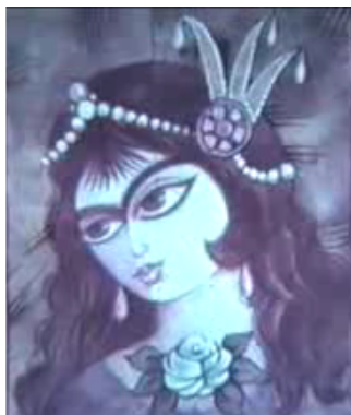
دختر ماهرو: «فیلم انیمیشن ملک خورشید »

چهره‌ی «دختر ماهرو» نیز با نقاشی چهره‌ی زنان در دوره‌ی قاجار، با ابروهای به هم پیوسته، چشمان بزرگ با خطوط محیطی پهن، و طره‌ی مو بر روی گونه‌ها طراحی شده و از نظر اجرایی به نگاره‌های زنان در هنر نگارگری ایرانی شباهت دارد، اما در کلیت دارای فرمی امروزی است. چهره‌ی معشوق به گونه‌ای طراحی شده که خلاف شخصیت‌های بدون احساس و منفعل نگارگری‌ها، دارای بیان احساسی قوی از طریق شاخصه‌های بصری است.