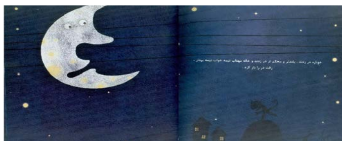
تصویر شماره‌ی ۲