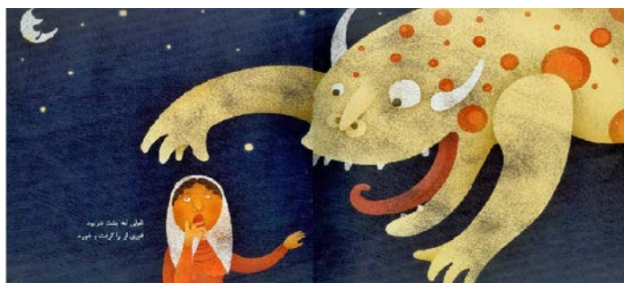
تصویر شماره‌ی ۳