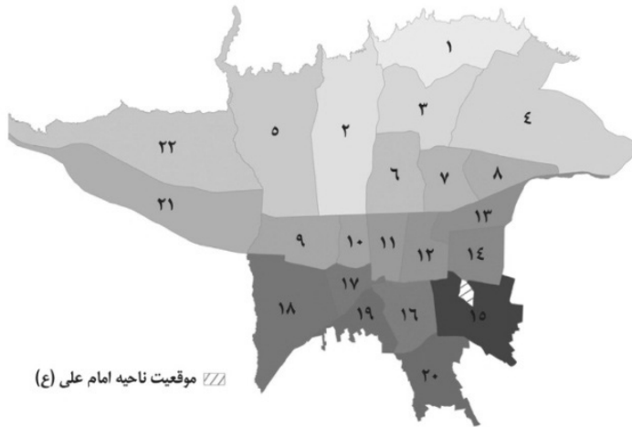
شکل ۲: موقعیت ناحیه امام علی در استان تهران منبع: (صادقیانی، ۱۳۹۲: ۱۳۴)

عواملی همانند وابستگی خانوارهای ساکن منطقه و اقشار کم‌درآمد شهر؛ ساخت بخش بزرگی از بافت مسکونی منطقه در فاصله سال‌های ۱۳۳۵ تا ۱۳۶۵ به دنبال هجوم مهاجران به شهر و اسکان در حاشیه آن و سیاست‌های مسکن و تفکیک زمین اعمال شده در آن سال‌ها؛ سابقه ساخت بخش قابل توجهی از بافت مسکونی منطقه در چارچوب مجموعه‌های مسکونی ارزان قیمت برای اقشار کم‌درآمد و... موجب شده است تا فشردگی بافت، ریزدانگی قطعات، تراکم بالای مسکن، معابر باریک و کم عرض و شبکه دسترسی نامناسب، فرسودگی کالبدی یا عملکردی بافت، واحدهای مسکونی کوچک، کوتاه مرتبه بودن ساختمان‌ها، ساخت‌وسازهای حاشیه‌ای با سیمای فقیرانه و فاقد معماری مشخص و... از مشخصه‌های بارز بخش بزرگی از بافت مسکونی منطقه و محله است که این عوامل، در کنار تعداد زیاد ساختمان‌های نیم کاره که به منظور نوسازی به تصرف و تملک سازمان نوسازی درآمده است و همچنین به سبب طولانی شدن پروژه، موجبات کاهش امنیت اجتماعی و حضور بیش از پیش بزه‌کاران در زمان قبل از نوسازی فراهم شده است؛ به همین دلیل محدوده محله مورد نظر به منظور سنجش صحت، میزان و اولویت تأثیرگذاری هر یک از مؤلفه‌های تدوین شده در الگوی مفهومی، توسط نگارندگان به عنوان نمونه موردی انتخاب شده است.