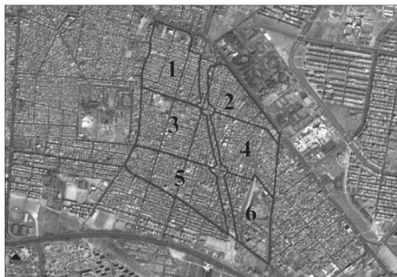
شکل ۱: محلات ناحیه امام علی منبع: (صادقیانی، ۱۳۹۲: ۱۳۵)

محله خوبخت در ناحیه امام علی (ع) در منطقه ۱۵ شهر تهران واقع شده است. بخش اعظم این ناحیه فرسوده بوده و تملک‌ها و تخریب‌های انجام شده - برای آزادسازی مسیر بزرگراه امام علی (ع) که از این ناحیه می‌گذرد - وضعیت بسیار نامطلوبی را رقم زده است. این شرایط در کنار تراکم جمعیتی بالا، کمبود خدمات شهری و ناکارآمدی دسترسی‌ها در بخش‌های داخلی بافت، سبب شده تا این محدوده به عنوان یکی از اولویت‌های نوسازی مطرح شود. یکی از شش قسمت حاصل از تقسیمات ساختاری ناحیه امام علی (ع)، محله خوبخت (محله ۴) است که از تجمع تعدادی کوی قابل شناسایی تشکیل شده است.