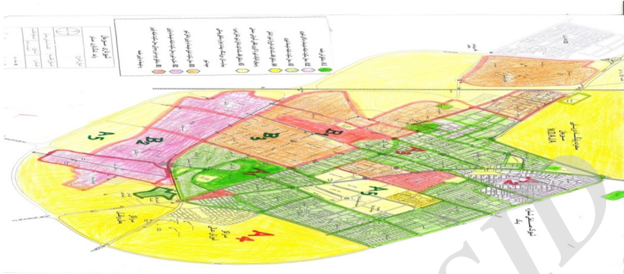
نقشه شماره 1- شهر سیرجان بر حسب طبقه‌بندی مناطق

نتایج حاصل از مطالعه مناطق مختلف شهر نشان می‌دهد که هر چه به طرف مناطق و سکونتگاه‌هایی با وضعیت اقتصادی - اجتماعی و فرهنگی بالاتر نزدیک می‌شویم تعداد مرتکبین جرایم، که محل سکونت‌شان چنین محلاتی باشد کمتر شده و بالعکس در مناطق با وضعیت اقتصادی - اجتماعی و فرهنگی پایین‌تر که افراد امکانات کمتری داشته و بیشتر به مشاغلی چون خرده‌فروشی مواد مخدر یا فروش کالاهای قاچاق اشتغال دارند، بیشتر هستند.