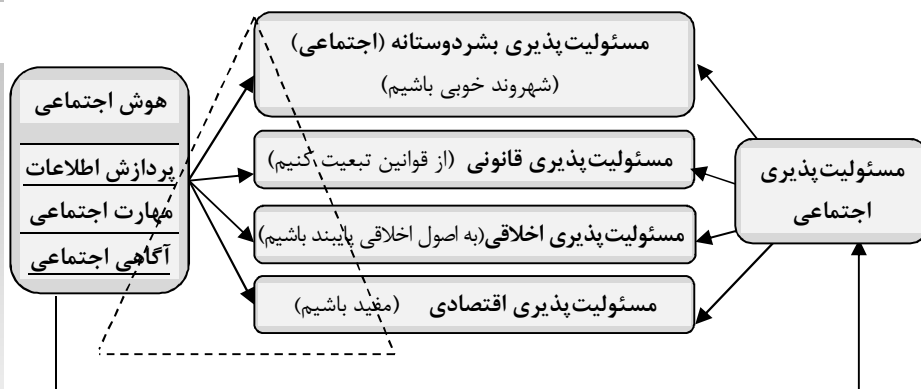
شکل شماره ۱. مدل مفهومی تحقیق و هرم مسئولیت پذیری کارول (۱۹۹۱)