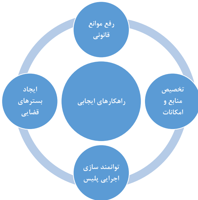
شکل شماره ۴. مضامین تشکیل‌دهنده راهکارهای ایجابی پیشگیری انتظامی از جرایم هزینه‌نگاری در فضای سایبر

پس از حذف و اصلاح و ادغام مضامین پایه مربوط به راهکارهای ایجابی چهار مضمون رفع موانع قانونی، ایجاد بسترهای قضایی، توانمندسازی اجرایی، تخصیص منابع و امکانات بدست آمد. منظور از راهکارهای ایجابی برنامه‌هایی هستند که می‌تواند در راستای تحقق اقدامات پیشگیرانه پلیس و به نتیجه رسیدن فعالیت‌های آنان مؤثر واقع گردد تا در نهایت امکان مدیریت جرایم هزینه‌نگاری در فضای سایبر را فراهم سازی نماید.