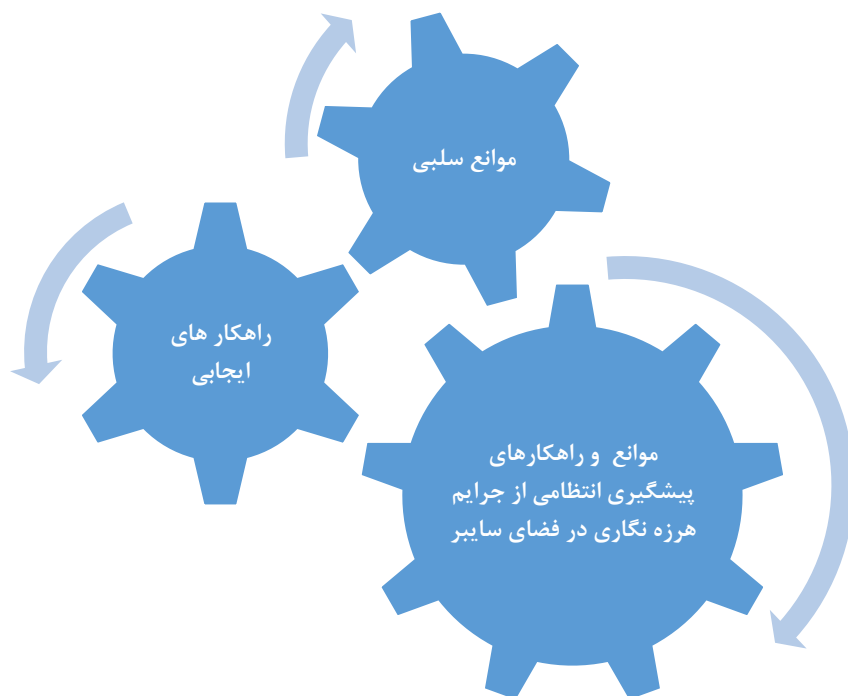
شکل شماره ۲. مضامین تشکیل دهنده موانع و راهکارهای پیشگیری انتظامی از جرایم هرزه نگاری در سایبر

بر اساس یافته‌های پژوهش و با تحلیل مضامین بدست آمده تعداد ۸ مضمون اصلی و ۶۵ مضمون فرعی بدست آمد که در نهایت در دو مضمون کلی چالش‌های سلبی و سیاست‌های ایجابی دسته بندی گردید.