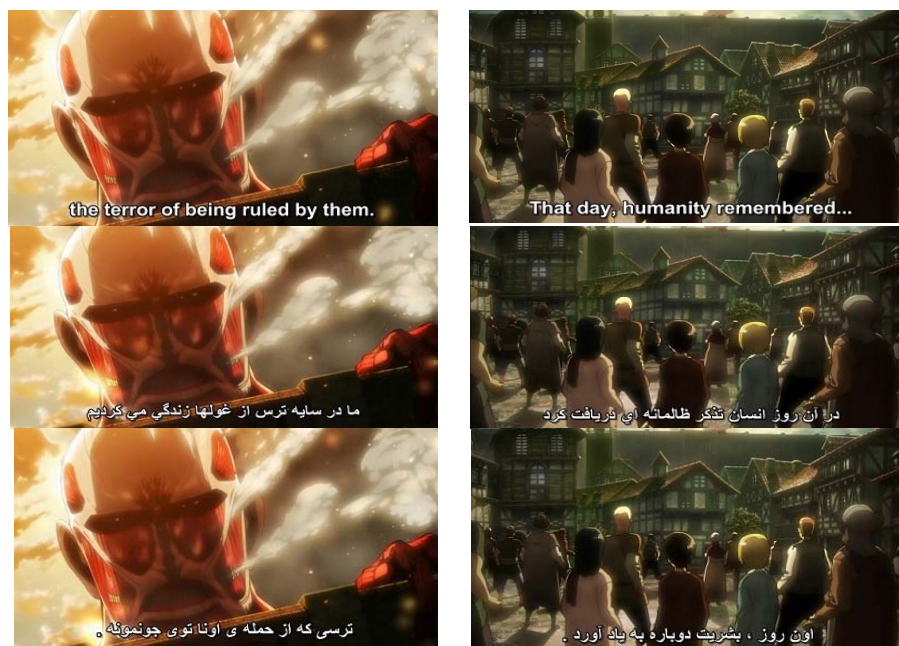
شکل ۶. ضعف دستوری در ترجمه زیرنویس غیر حرفه‌ای فارسی انیمه حمله به تایتان ۱۷

مفهوم متن اصلی را به درستی متوجه شده‌اند، اما ترجمه هردو نفر دارای غلط‌های مشخص دستورزبانی و معنایی است.