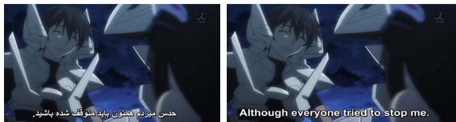
شکل ۴. نمونه ضعف معنایی در ترجمه زیرنویس غیرحرفه‌ای فارسی انیمه آی‌اس ۱۵

در نمونه شکل ۴، مسلط‌نبودن مترجم در درک جمله زبان خارجی کاملاً مشهود است. مترجم مفهوم و معنای جمله را درک نکرده و تلاش کرده با ترجمه کلمه‌به‌کلمه گفتگو، معنای آن را به فارسی برگرداند، اما در همین امر نیز ناموفق بوده است.