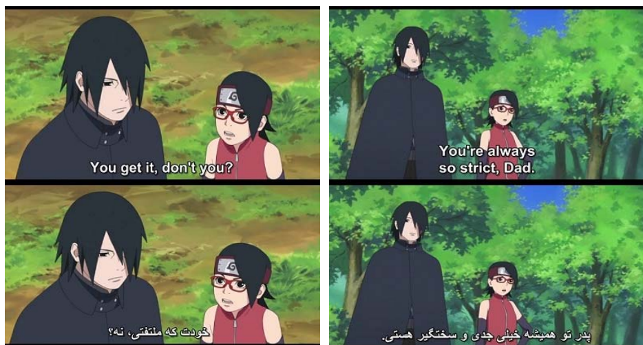
شکل ۷. ضعف انتخاب لحن در ترجمه زیرنویس غیرحرفه‌ای فارسی انیمه بروتو:ناروتو ۱۸

در نمونه دوم زیرنویس فارسی شکل ۶، مترجم دیالوگ اول را به درستی ترجمه کرده اما در جمله دوم مفهوم «حاکمیت» را به «حمله» تغییر داده است. همچنین لحن مترجم به‌طور محسوسی از ادبی به عامیانه تغییر می‌کند و نمایی ناخوشایند را به وجود می‌آورد. این مسئله نیز از ایرادهای محسوس کار مترجمان فارسی‌زبان است که در بسیاری از زیرنویس‌ها دیده می‌شود.