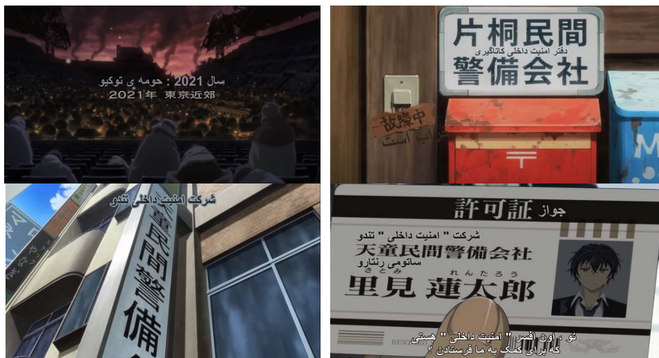
شکل ۲. جایگذاری ترجمه پیغام‌های زبانی در تصویر از زیرنویس غیرحرفه‌ای انیمه گلوله سیاه ۲

خیابان‌ها، مدارس، نام تابلوهای راهنمایی و رانندگی یا اعلانات که در ادبیات پژوهش نشانه‌نظام تصویرنگاشتی ۱ نامیده می‌شوند (چومه، ۲۰۰۴)