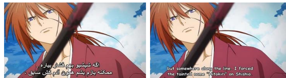
شکل ۵. ضعف مفهومی در ترجمه زیرنویس غیرحرفه‌ای فارسی انیمه کنشین شمشیرزن دوره‌گرد ۱۶

در نمونه شکل ۵، مترجم برخلاف نمونه شکل ۴ تلاش کرده مفهوم دیالوگ را برساند و از ترجمه کلمه‌به‌کلمه خودداری کند با این حال به دلیل نداشتن تسلط کافی به زبان دوم بیراهه رفته و ترجمه‌ای کاملاً نادرست ارائه داده است. در دو نمونه زیرنویس غیرحرفه‌ای فارسی (شکل ۶)، هردو مترجم به‌طور نسبی مسلط‌تر از دو مثال قبل عمل کرده‌اند و می‌شود گفت