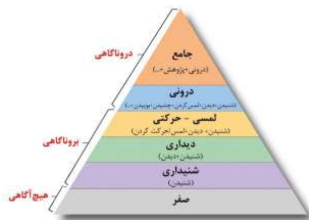
نمودار ۲. هرم هیجامد (پیش‌قدم، ۲۰۱۶)

حوزه‌های سه‌گانه مذکور، در نمودار ۲، به شکل گویاتر و مشخص‌تری به نمایش در آمده است.