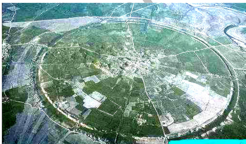
شکل (۱) نمایی از شهر باستانی گور