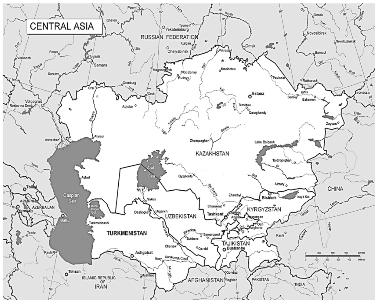
نقشه شماره ۱. نقشه سیاسی منطقه آسیای مرکزی.