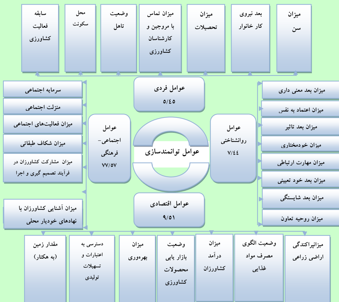
شکل شماره ۳: مدل نهایی پژوهش؛ عوامل موثر بر توانمندسازی کشاورزان و درصد تبیین هر یک از آنها

عامل دوم: متغیرهای قرار گرفته در این عامل شامل: وضعیت الگوی مصرف مواد غذایی، میزان درآمد کشاورزان، میزان پراکنش اراضی کشاورزی، میزان بهره‌وری، دسترسی به اعتبارات و تسهیلات تولیدی، وضعیت بازار یابی محصولات کشاورزی و مقدار زمین به (هکتار) کشاورزان می‌باشند. همان طور که ملاحظه می‌گردد بار عاملی این متغیرها بین ۰/۴۹ تا ۰/۸۰ متغیر است و تمامی متغیرها با عامل دوم همبستگی مثبت دارند. با توجه به ماهیت متغیرهای تشکیل دهنده، نام «عوامل اقتصادی» برای این عامل انتخاب گردید. که با مقدار ویژه (۰/۸۱)، در مجموع (۱۸/۷۵) درصد از واریانس کل را تبیین می‌کند.