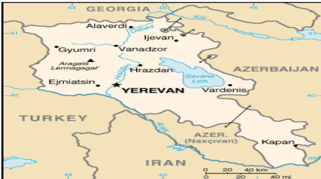
نقشه شماره ۵- کشور ارمنستان