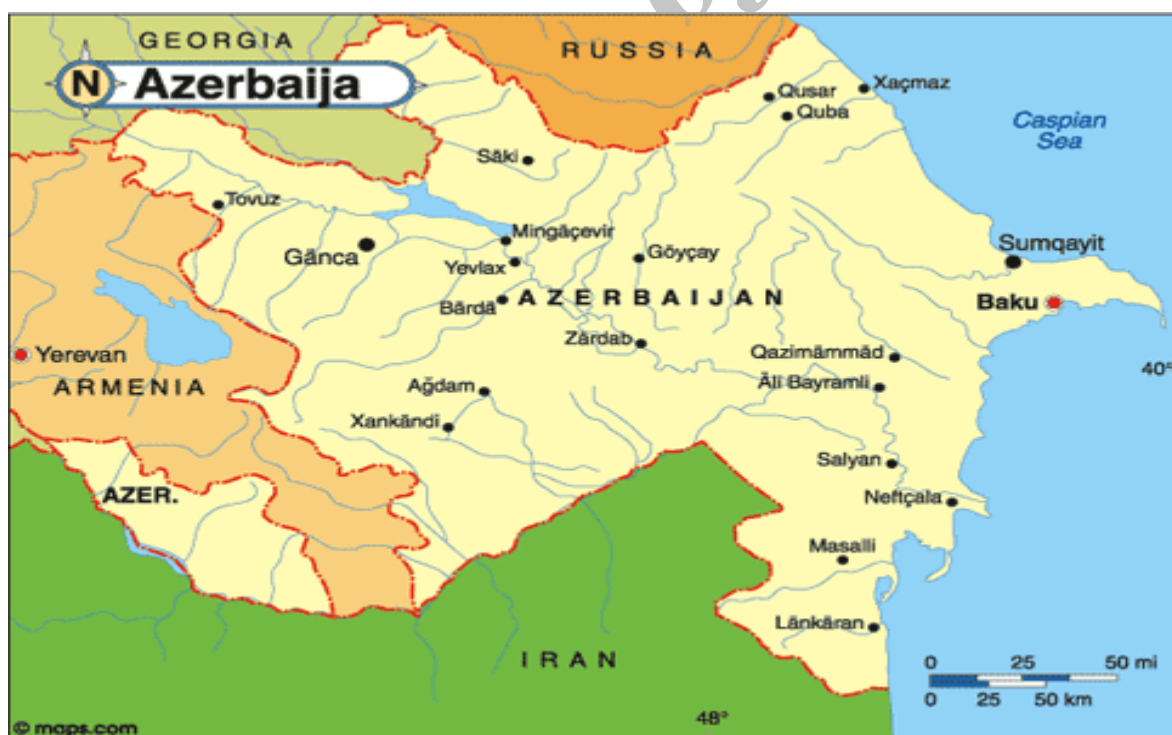
نقشه شماره ۴- کشور آذربایجان