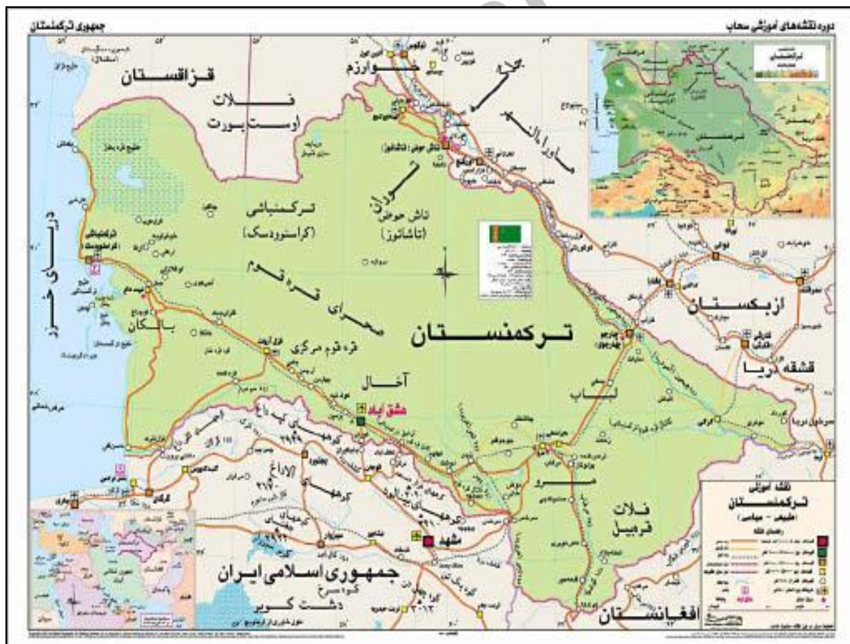
نقشه شماره ۶- کشور ترکمنستان