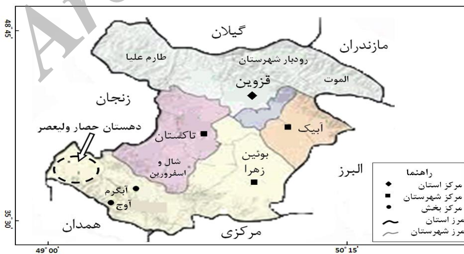
شکل ۲: موقعیت منطقه مورد مطالعه در استان قزوین