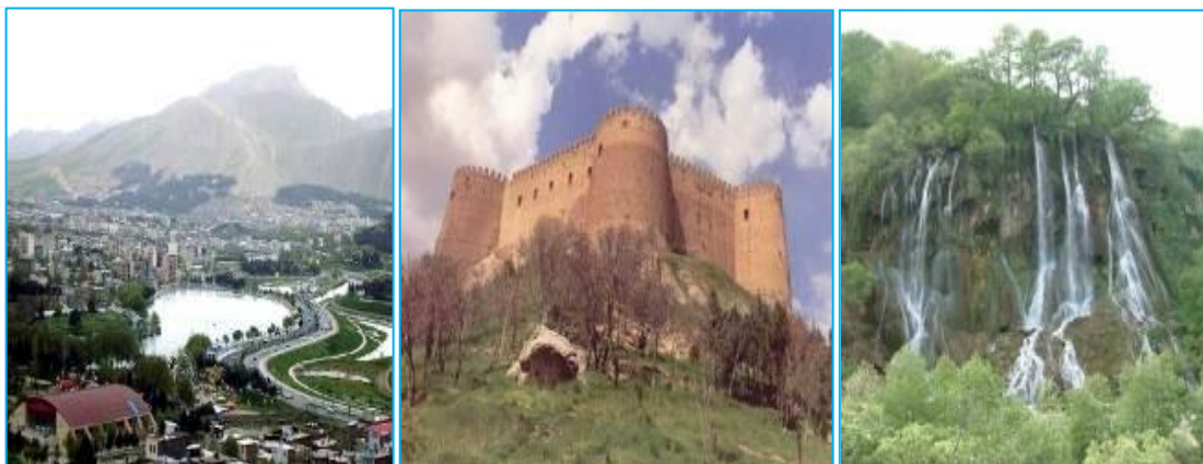
دریاچه کیو و نمایی از آن