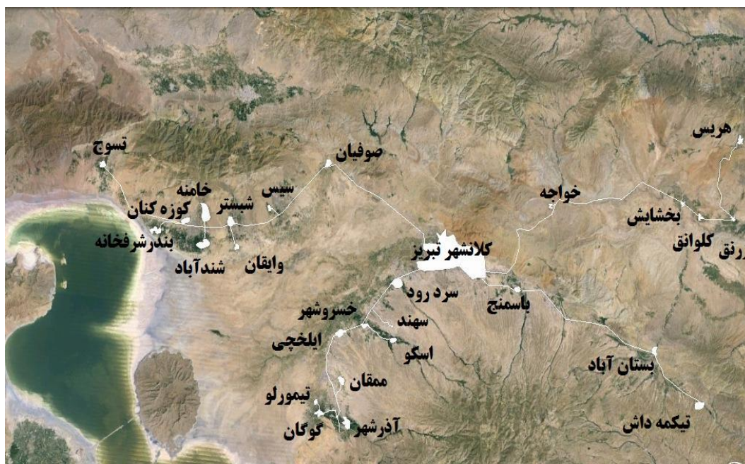
شکل ۱: نقشه موقعیت جغرافیایی و سیستم شهری-منطقه‌ای مربوط به منطقه کلانشهری تبریز

سطوح توپوگرافی بین ۱۳۰۰ الی ۱۷۵۰ متری به صورت طولی استقرار یافته است. این شهر در محدوده عرض‌های جغرافیایی ۳۶ درجه؛ نه دقیقه الی ۳۸ درجه و یک دقیقه طول‌های شرقی ۴۸ درجه و ۲۳ دقیقه الی ۴۶ درجه و ۱۱ دقیقه با ارتفاع متوسط ۱۳۴۰ متر از سطح آب‌های آزاد در سطح جلگه‌ای به همین نام واقع شده و در حال توسعه است (عابدینی و همکاران، ۱۳۹۱: ۲۵۱).