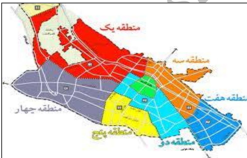
شکل ۳: محدوده مناطق مورد مطالعه شهر شیراز