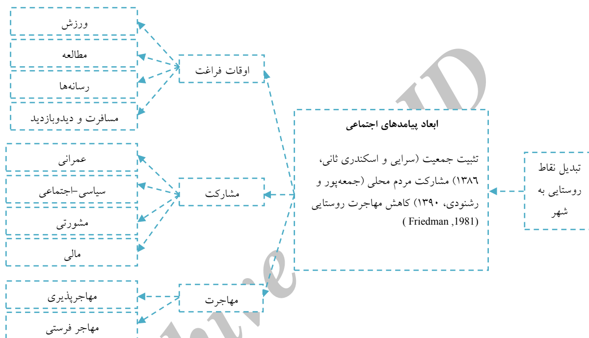
شکل ۱: ابعاد اجتماعی تبدیل نقاط روستایی به شهر در بخش اجتماعی

(۱۳۸۰)، شیخی (۱۳۸۲)، فنی (۱۳۸۲)، کامیار (۱۳۸۲)، قادرمزد (۱۳۸۳)، پریشان (۱۳۸۵)، رضوانی (۱۳۸۸) و طاهری (۱۳۹۰) اشاره کرد؛ مطالعات فوق بیش تر جنبه‌های کالبدی، اقتصادی و زیست‌محیطی تبدیل نقاط روستایی به شهر را مطالعه کرده و کم‌تر به جنبه‌های اجتماعی آن توجه کرده‌اند. ولی هدف مقاله حاضر ارزیابی تاثیرات اجتماعی (نحوه گذران اوقات فراغت، مشارکت و مهاجرت) تبدیل نقاط روستایی به شهر است.