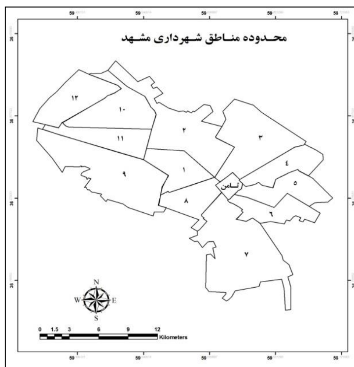
شکل ۱: نقشه مناطق شهر مشهد

شهر مشهد با مساحت ۲۰۴ کیلومتر مربع و جمعیت ۲/۵ میلیون نفر به‌عنوان بزرگ‌ترین شهر استان خراسان رضوی و یکی از مهم‌ترین شهرهای ایران مطرح است. ساخت اصلی شهر فعلی در ۲۵ سال اول قرن حاضر پایه‌ریزی شده است. خیابان، میدان و ساختمان‌های دولتی سه عامل هدایت توسعه شهر را به عهده داشته‌اند. شهر دارای دو مرکز اصلی است. چهار سمت شهر از طریق چند خیابان اصلی به میدان مرکزی اتصال می‌یابد. از سال ۴۵ به بعد توسعه شهر منطبق با طرح جامع هدایت شده است. مراکز تجاری و خدماتی در اطراف حرم و قطاع غربی تمرکز یافته‌اند و واحدهای مسکونی در دو محور غرب و شرق قرار دارند (معاونت معماری و شهرسازی مشهد، ۱۳۹۱). محدوده مورد بررسی، مناطق ۱۳ گانه شهر مشهد می‌باشد (شکل ۱).