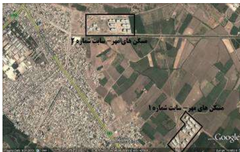
شکل ۳: قرار گرفتن مسکن‌های مهر بر روی زمین‌های حاصلخیز کشاورزی

همچنین مجتمع‌های مسکن مهر میاندوآب بر روی حاصلخیزین و بهترین خاک‌های کشاورزی از نظر زراعی مکان‌گزیده‌اند که بیانگر ناسازگاری کامل کاربری اراضی زارعی و محیط ساخته شده است. هر دو سایت مسکن مهر این شهر در داخل و در مجاورت باغات و اراضی کشاورزی احداث شده‌اند (شکل ۳) که این موضوع نه تنها موجب از بین رفتن اراضی کشاورزی و پایین آمدن راندمان تولیدی محصولات زراعی باتوجه به غالبیت فعالیت کشاورزی در این شهرستان می‌شود، بلکه در چند سال آینده تهدیدی برای زمین‌های مجاور این مجتمع‌ها محسوب می‌گردد. چرا که اینگونه اراضی که جهت الحاق به اراضی شهری و کسب سود بیش‌تر برای مدت کوتاهی بلااستفاده می‌مانند و در نهایت با رشد پراکنده شهر و قرارگرفتن در محدوده قانونی شهر به کاربری‌های شهری تغییر می‌یابند.