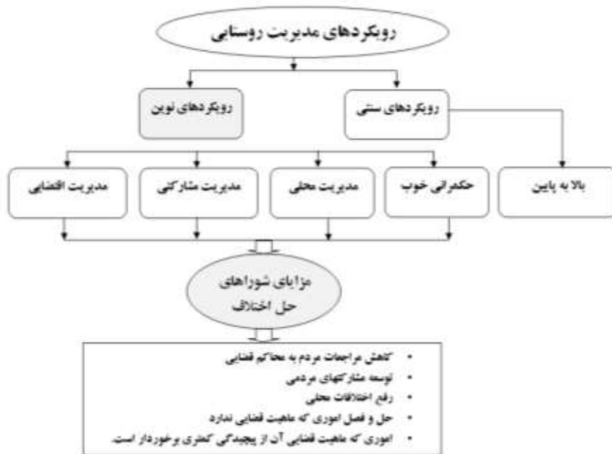
شکل ۱: شورای حل اختلاف، اهمی در راستای تحقق رویکردهای نوین مدیریت روستایی

از مزایای به‌کارگیری مدیریت محلی تاکید بر افزایش مشارکت مردم محلی می‌باشد که از زمره شاخص‌های دستیابی به حکمروایی مطلوب در فضاهای روستایی به‌شمار می‌آید که شوراهای حل اختلاف با تامین این شرایط به حضور و مشارکت مردم و همچنین استفاده از پتانسیل‌های محلی فضاها برای مدیریت و توسعه آن‌ها گام برداشته‌اند (Puglies, 2001: 14) (شکل ۱).