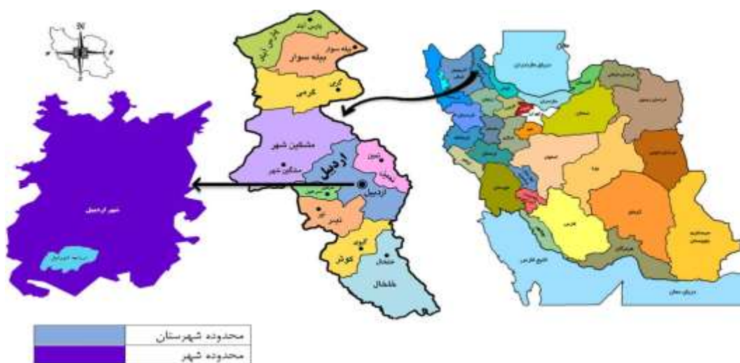
شکل ۱: موقعیت شهر اردبیل در استان و کشور

شهر اردبیل مرکز استان اردبیل در شمال غربی کشور و در موقعیت جغرافیایی ۳۸ درجه و ۱۵ دقیقه عرض شمالی و ۴۸ درجه و ۱۷ دقیقه طول شرقی واقع شده است (Statistical Center of Iran, 2017). شکل (۱) موقعیت شهر اردبیل را در سطح کشور، استان و شهرستان اردبیل نمایش می‌دهد.