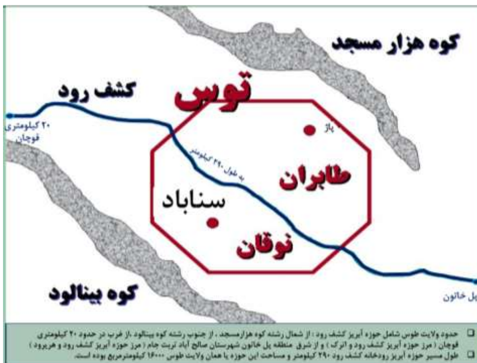
شکل ۱- حوزه جغرافیای تاریخی-فرهنگی توس (خطه توس-حوزه آبریز کشف‌رود)

شاعران پارسی، فرهنگ اصیل پهلوانی و ورزش‌های باستانی جاری در منطقه نظیر کشتی و ...، موقعیت بسیار ممتاز و مناسبی دارد (سند راهبردی باززنده‌سازی توس، ۱۳۹۶).