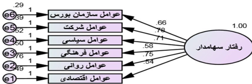
شکل (۳): تحلیل عاملی تأییدی مرتبه دوم

بر اساس داده‌های آماری پیمایش و مبتنی بر تحلیلی مدلسازی معادلات ساختاری همانطور که در نمودارهای تأیید عاملی مشاهده می‌شود (شکل ۳ و ۲)، کلیه متغیرهای مکنون رابطه معناداری با گویه‌ها داشته و می‌توانند آنها را تبیین کنند.